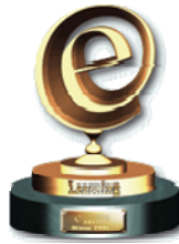
eLearning Award 2005 des eLearning- Journals