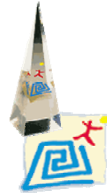
Initiativ-Preis Aus- und Weiterbildung 2005 des DIHT und der Wirtschaftswoche